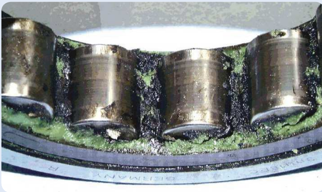
Degradación del lubricante causada por corrientes eléctricas